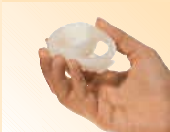
» DAS LEA CONTRACEPTIVUM