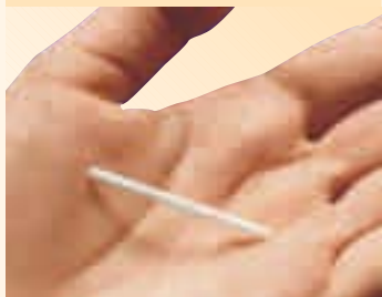
» DAS HORMONIMPLANTAT