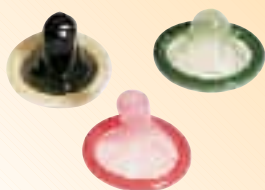
» DAS KONDOM