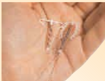
» DIE SPIRALE