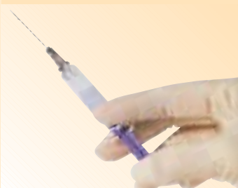
» DIE DREIMONATSSPRITZE