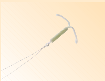
» DIE HORMONSPIRALE

Bei der passenden Auswahl berät die Ärztin oder der Arzt, die zudem mögliche gesundheitliche Risiken abklären. Auch in Beratungsstellen ist es möglich, Unterstützung bei der Auswahl eines geeigneten Verhütungsmittels zu finden.