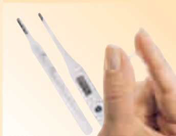
» DIE NATÜRLICHEN METHODEN