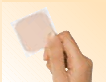
» DAS VERHÜTUNGSPFLASTER