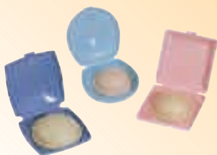
» DAS DIAPHRAGMA