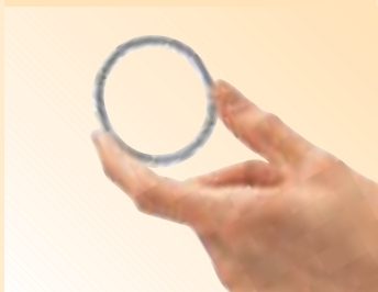
» DER VAGINALRING